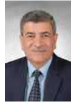
أ.د. محمد أحمد المجالي رئيس اللجنة العليا رئيس الجامعة